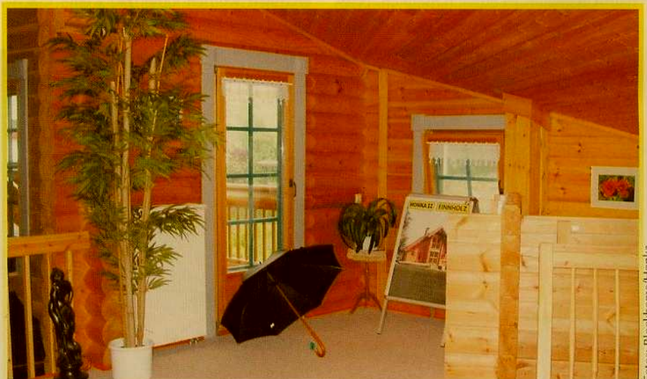
Auf der Galerie im Obergeschoss befindet sich die Muster-Ausstellung der Firma Finnholz, drei großzügig bemessene Räume unter einer leichten Dachschräge.

der Sache beschäftigt. Mit einem Ventilatormessgerät werden die Blockhäuser nach der Montage auf Leckagen geprüft. So kann ggf. frühzeitig nachgebessert werden. Dies ist für Finnholz keine Frage der Gewährleistung sondern eine reine Qualitätssicherung.